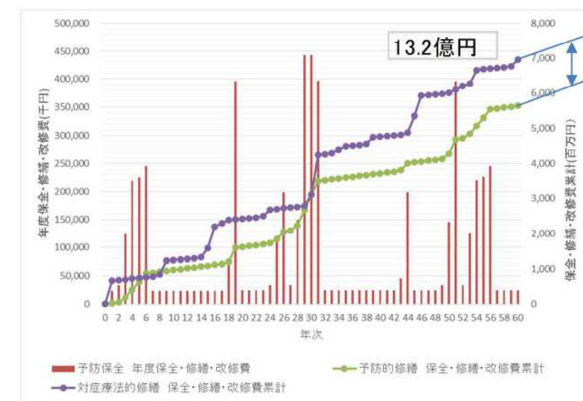
表 8-1 エスカレーターとエレベーターの予防保全と対症療法的修繕の修繕費