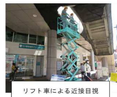
リフト車による近接目視