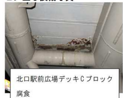
北口駅前広場デッキCブロック 腐食