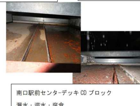
南口駅前センターデッキCDブロック 漏水・滞水・腐食