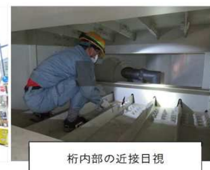
桁内部の近接目視