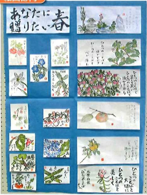
絵手紙「あなたに贈りたい春」

民の方々、また、コロナ禍の中、来場された延べ255名の方々にも、厚く御礼申し上げます。来年度も今から準備していただき、1点でも多くの出展をお願いいたします。