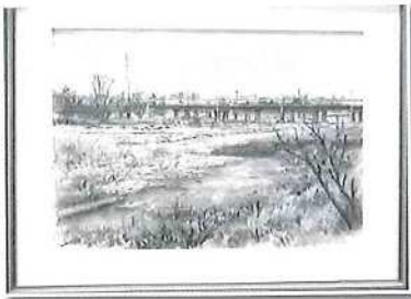
水彩画「多摩川日和」