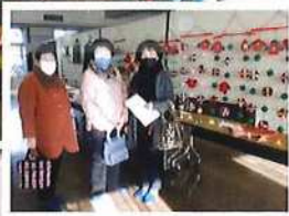
つるし飾りを鑑賞