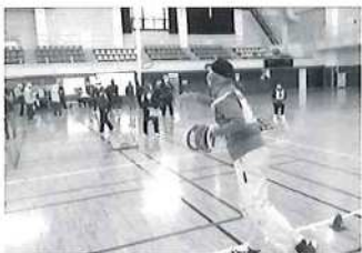
魂を投入して一投にむかって

ナ禍の使用 時間内で15 チームが6 回戦を終え ることがで きました。 立老連のチ ームは、優