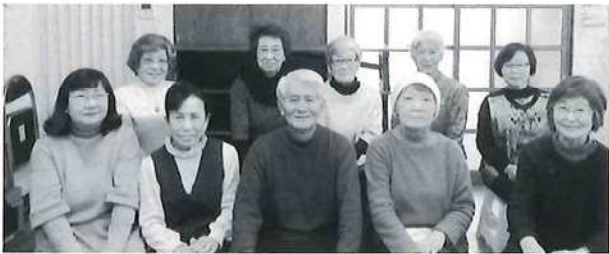
活動メンバーで笑顔の1枚

ンティアではない』をスローガンに有意義で楽しく意味のある地域活動を通じて、会員の皆様と一緒に『感謝し合える我が町』にしたいと思えます。