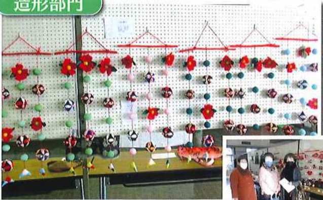
縫い物「つるし飾り」