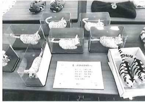
縫い物「ホワイトタイガーほか」