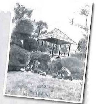
水彩画「柴崎福祉会館」