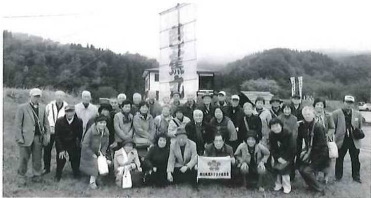
最上川を舟で下りました

早朝6時から立川市内をバスで廻ってもらい、参加者36名による約1000キロのバス旅行が始まりました。平日早朝のため渋滞も無く、入間ICから高速に入り、東北道・東北中央道を走り予定どおり12時過ぎに米沢に到着しました。登録有形文化財・上杉伯爵邸で贅沢な米沢牛すき焼き膳をいた