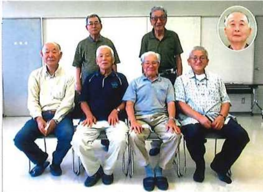
今後より良い会報づくりを目指します

第142号の会議は7月16日に開催され、第1回広報部会で編集方針が決定、それに基づき原稿や広告の収集、掲載記事の割り付け等々に奔走しました。11月早々、ニチコミに原稿を送付、ゲラの完成を待ちました。校正会議は、より良い会報発行