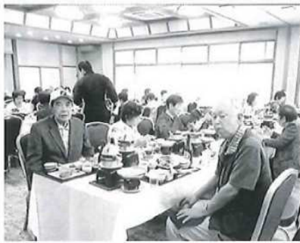
ホテル長生館での昼食風景

かけの会2名、公社東会5名、東栄長寿会3名、南寿会1名、協力長寿会5名、東友明朗会7名、高松千歳会4名、東明和会1名) 2号車25名(完成会1名、柴四東弥生会4名、富久寿会3名、万寿美会2名、西富士見会2名、協和敬老会1名、翔年会7名、東富士見会2名、日和会3名) 3号車32名(いきいき会4名、元気クラブ2名、喜楽会4名、徒耆羽会6名、松寿会4名、はねみ会2名、金襴会4名、事務局1名、錦五友之会4名、錦つぼみ会1名) 早朝から3台のバスが市内を廻り参加者を集め、関越道花園SAで合流しました。以後、1号車、2号車、3号車の大名行列での移動となりました。見学した箇所を紹介します。