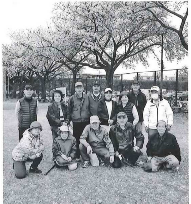
桜の下で記念撮影

コアは二の次で誰でも参加するスタイルでやってきましたが、最近ではゴルフ部が、月2回の活動を担当することになりました。成績順で支給される贈り物の賞品の影響か、ホールインワンが多く出るようになりました。大会での好成績を期待しています。