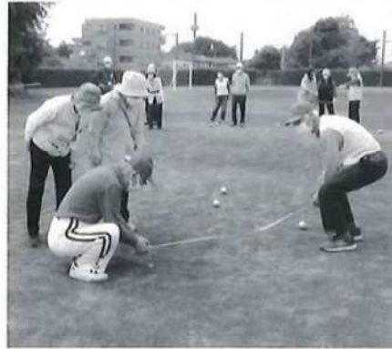
誰の玉がピュットに近いかな

立老連では、老人クラブの目的である高齢者の健康・介護予防・友愛活動の一環として、軽スポーツ大会を実施している。年に一度の軽スポーツ大会であるので各チームとも一年間の練習成果を出すため大いに頑張った。