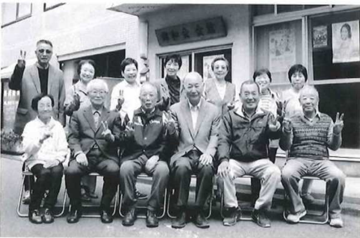
50周年時はマスクもなく笑顔で集まっていました

最近になって、ようやく新型コロナウイルスの発生減少化の傾向が見られますので、今後とも感染対策を行いながら会員の皆様と楽しく老人会の活動に取り組み、創立55周年を迎えたいと思います。左の写真は、前回の創立50周年を祝う会で撮影したものです。