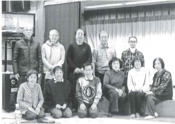
気の合う仲間と活動を楽しむ

昭和37年3月「親しまれ、役に立つ高齢者になろう」を合言葉として結成され、令和3年には60周