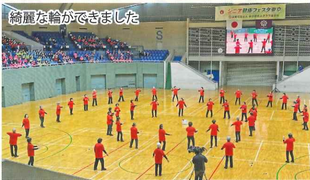
綺麗な輪ができました