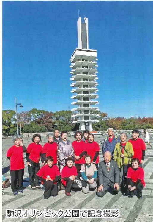
駒沢オリンピック公園で記念撮影