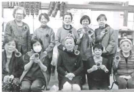
お揃いの花を胸に

多摩川会の歴史は古く、昨年の新会員は2名いたものの、古くからの会員が少しずつ減少している