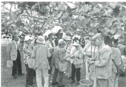
合同バス旅行「ぶどう狩り」

またボランティア活動の希望や社会貢献の気持ちがある方々といベントを計画していくことが必要と思っています。会員の希望をどうすくい上げ計画していくかを考えて会員の増員を成し遂げたいと思っています。