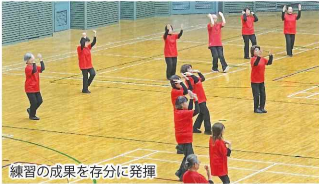
練習の成果を存分に発揮