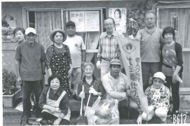
地域に貢献できるよう頑張っています