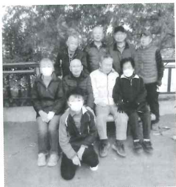
仲良く元気に活動中

南富士見会は、富士見町4丁目、5丁目からなる住宅街に囲まれた静寂な町で、現在、男性32名、女性29名、合計61名で活動しています。