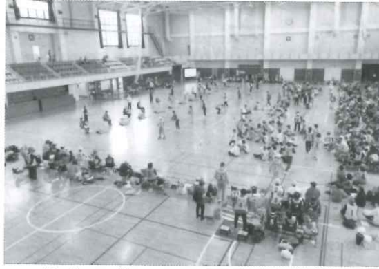
投げる距離 4.5 m (ローカルルール)