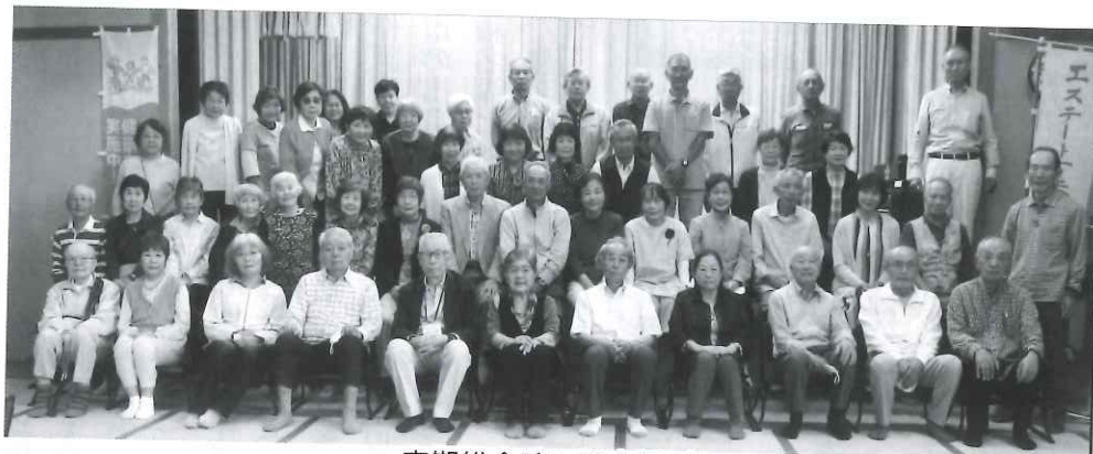
定期総会時に記念撮影