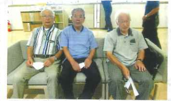
楽しい旅行の企画を練っています

立老連の旅行は、昭和50年度から3泊4日の日程で開始され、昭和57年度から平成5年度までは毎年300名から490名もの参加者がありました。しかし、平成6年度から参加者が減少に転じ、平成14年度から2泊3日の日程となり、平成21年度からの参加者は70名以下となりました。令和の時代に入ると、コロナ禍のため令和2年度は中止、3年度は36名、4年度は33名とさらに少なくなりました。これから先、親睦旅行の開催が続いていけるか心配です。令和5年度から旅行部員は3名となりま