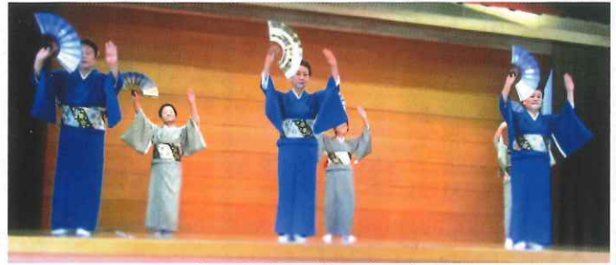
青の着物で揃えました