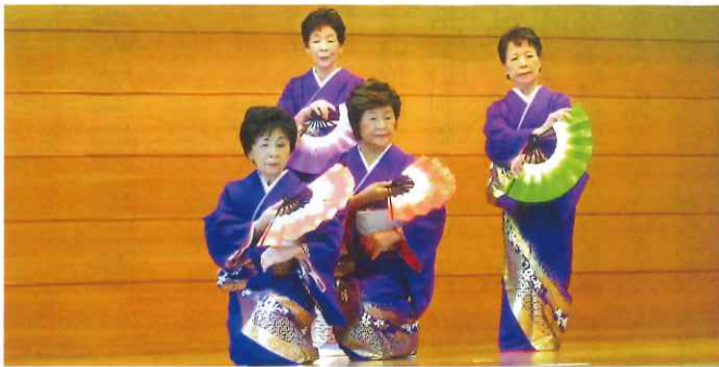
色違いの扇子で華やかに