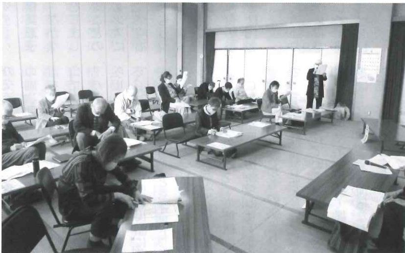
発足したばかりの新クラブです

主体は一番町5丁目アパートの住民ですが、砂川西部地区周辺の会員も加わって構成されています。令和4年4月より、立老連事務局・立川市生きがいづくり担当職員に指導いただきながら、毎月、設立準備委員会を重ねてまいりました。令和5年4月10日(月)、一番福祉会館において設立総会を開催しました。会員34名(男性11名、女性23名)、出席者21名、委任状12名をも