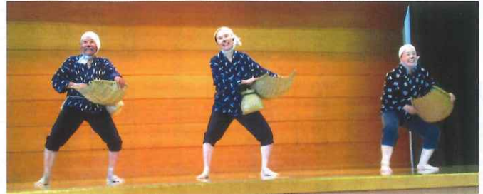
笑顔でどじょうすくい