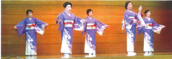
艶やかに舞を披露

立川市老人クラブ連合会広報部 発行責任者 村本 慎治 〒190-0023 立川市柴崎町 5-11-26 立川市柴崎福祉会館内 電話 042-523-4012 042-521-3733 (直通) 制作・印刷 株式会社ニチコミ 電話 03-5718-3900 http://www.nichicomi.com