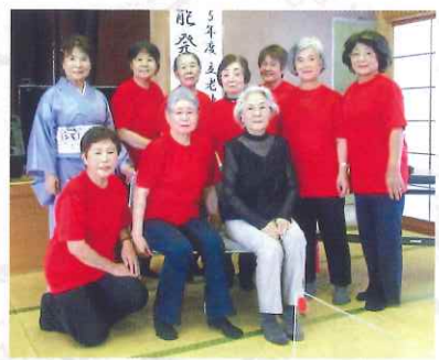
お揃いの衣装でにっこり