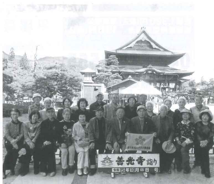
善光寺で記念の1枚