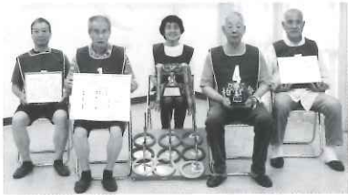
輪投げ大会 優勝 柏寿会

立老連から4月22日(土)、立老連輪投げ大会にて優勝した柏寿会、2位の末広会が参加。東老連大会での成績は1位柏寿会694点、2位末広会510点。