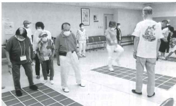
マスにあわせてステップ

引き続き、後期4日間の講習を行います。また、来年度も講習を計画しますので、大勢の参加をお待ちしております。