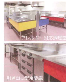
アレルギー対応調理室

アレルギー対応食はIHコンロで調理を行います。IHコンロの下には引き出し型冷蔵庫を設け、個別対応となるアレルギー対応食の食材の仕分けを確実にします。