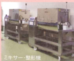
ミキサー・整形機