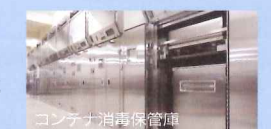
コンテナ消毒保管庫