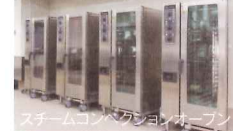
スチームコンベクションオープン