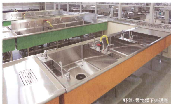
野菜・果物類下処理室

果物類、葉物類、根菜類の三槽シンク6レーンに加え、豆腐専用レーンを設けた野菜・果物類下処理室や四槽シンクを設けた割卵室など食材を確実に洗浄します。