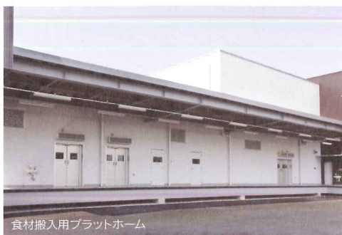
食材搬入用プラットホーム

納品した食材は「野菜類」、「肉・魚」、「卵」、「米」に分けて荷受けを行い、食材の交差による二次汚染を防止します。地元産の泥付き野菜は荷受室で泥落としを行います。