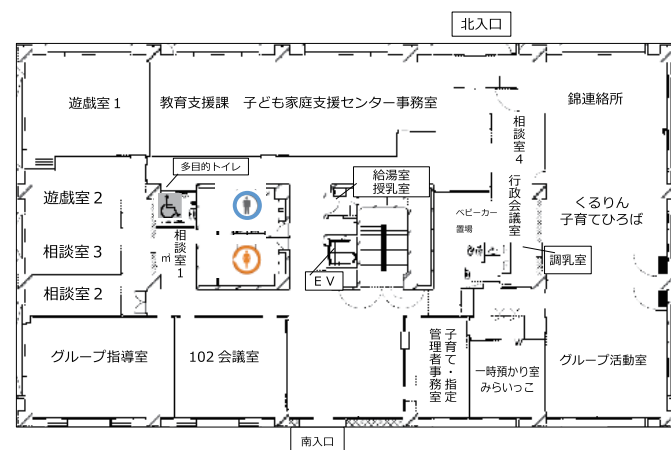
子ども未来センター 1階フロアー 子育て支援ゾーン案内図