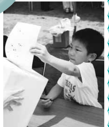
▲100年後のみなさん 読んでくれるかな...

平成22年2月の完成を目指して これから1年半程度をかけて、主に次のような予定で工事を進めていきます。