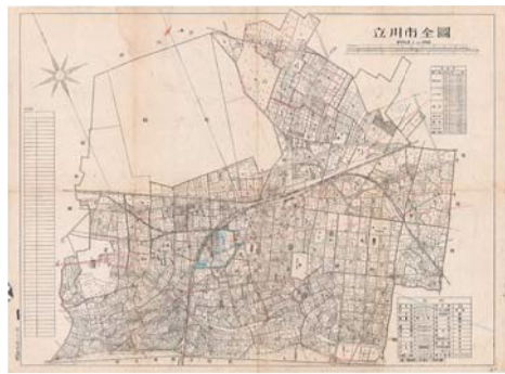
立川市全図 昭和21(1946)年

明治初期の珍しい絵図をはじめ、平成30年までの地図・絵図資料87点を収録。時代による立川の街並みの変遷を地図で振り返ります。個別テーマを取り上げたコラムも掲載。付録のDVDには主要な地図を高精細データで収録しています。