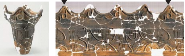
阿玉台式土器の文様を展開した写真 (竹内勇貴氏寄贈資料、歴史民俗資料館蔵)

竹内勇貴氏寄贈資料は、向郷遺跡で発掘された縄文時代中期の良好な資料群です。土器や石器を紹介するほか、土器に含まれる鉱物の分析や、粘土に残された植物種子の圧痕の分析結果も掲載しています。向郷遺跡の新たな一面を探る調査報告書です。