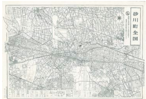
砂川町全図 昭和38(1963)年ごろ