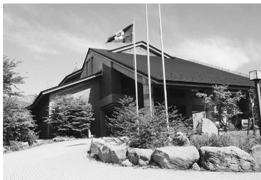
山梨県清里高原にある立川市八ヶ岳山荘

山梨県の清里高原に校外教育の場として、立川市八ヶ岳山荘を開設しています。八ヶ岳山荘は、平成3年に完成した本館（通年利用可）や大体育館などのほか、小体育館、炊事棟などからなり、小学校の自然教室や中学校の移動教室、青少年団体の自然の家等で利用されているほか、学校や団体が利用しない期間は、市民保養施設として一般の方へ開放しています。