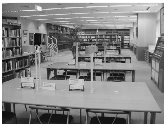
中央図書館レファレンス室

質問は、各図書館に来館のほか電話やEメールでも受け付けています。その場で調べがつかない場合は、都立図書館や国会図書館に問い合わせる回答します。