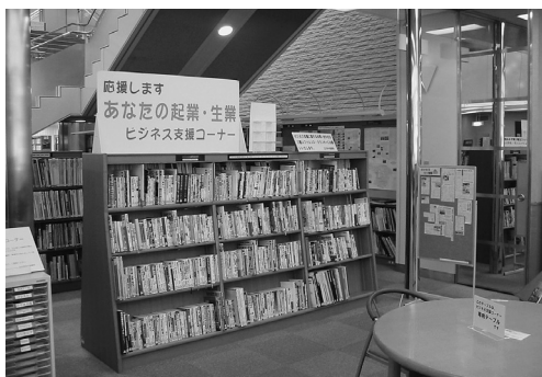
中央図書館ビジネス支援ライブラリー