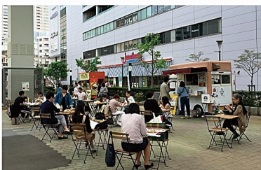
昨年のオープンカフェの様子

立川商工会議所の提唱する「まち・こころ 花めかそう」の事業で、年間を通じて「花」をテーマにしたイベントを展開しています。このイベントはサンサンロードを起点としたにぎわいの創出と地域振興を目的に行われています。通り掛かった方にちょっと寄っていただけのような、ほっとする空間を目指します。また、国営昭和記念公園では、5月30日(日)までフラワーフェスティバルを開催中ですので、併せて花めく立川をお楽しみください。