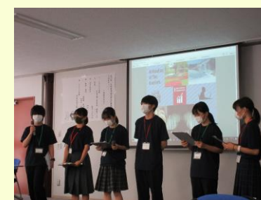
ジェスチャーも交えながら、英語でSDGsについて発表しました。