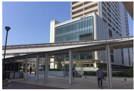
⑤ 正面方向に見える大きな建物がタクロスになります。