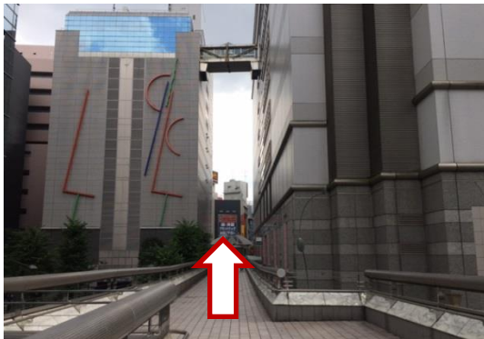
② デッキ上を道なりに歩きます。