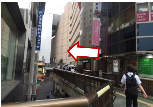
③ 伊勢丹を右手に通過し、つきあたりまで歩きます。