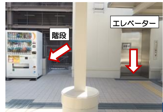
⑦ 自動販売機の隣に階段、またはエレベーターがあります。1番下の階まで下りてください。