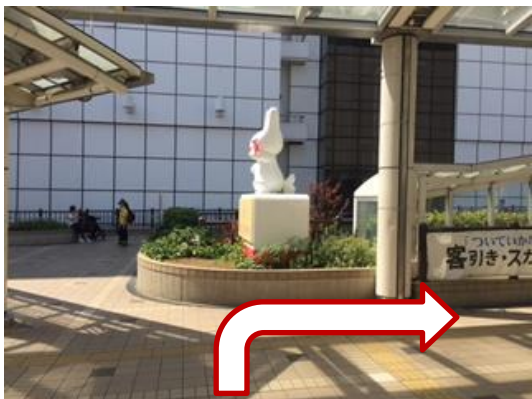
④ つきあたりを右に曲がります。 (正面にくるりんの像がありますので、像の手前を右に曲がってください。)