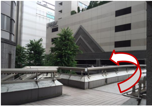
① 2階出口から出てデッキ上を、パレスホテルを右手に進みます。