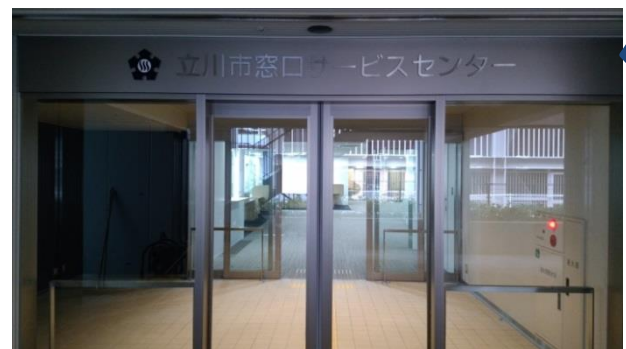
⑧ エレベーターを降りると正面、階段で1番下の階まで下りると左手が窓口サービスセンターの入り口です。

窓口サービスセンター専用の駐車場・駐輪場はありません。 自転車でお越しの方は、当センターの上にある自転車駐車場をご利用ください。 (3時間以内のご利用であれば無料です。)