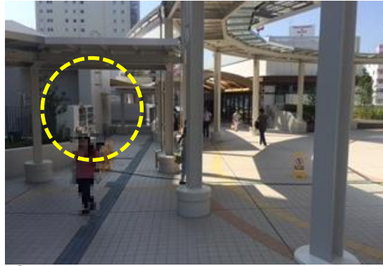
⑥ 窓口サービスセンターの入り口へは、タクロスの向かい側にある階段、またはエレベーターで1番下の階に下りていただきます。