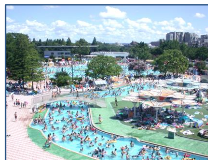
▲レインボープール

注：平成30年度より子ども料金の無料化に伴い「子ども」の入園者数は「無料」に含む。