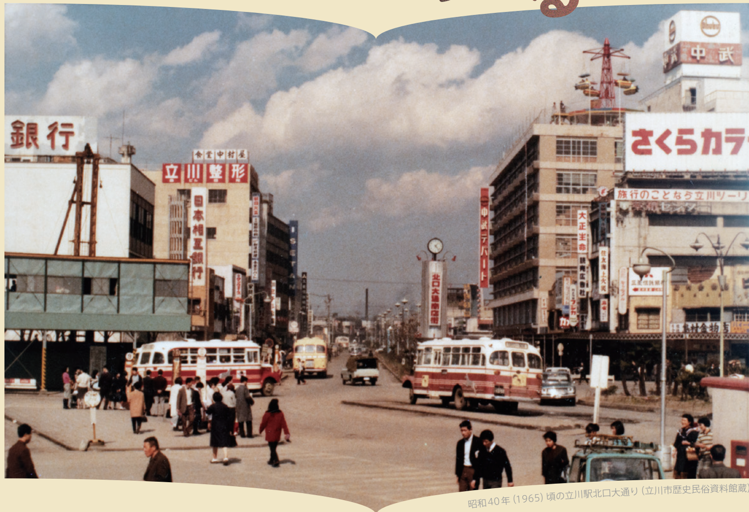
昭和40年(1965)頃の立川駅北口大通り(立川市歴史民俗資料館蔵)