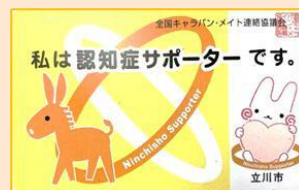
認知症サポーターカード