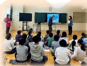
小学校認知症サポーター養成講座の様子

認知症は誰でもなる可能性のある病気です。認知症であるということを普通のこととして捉え、認知症に対する偏見をなくしていくことが大切です。認知症になっても住み慣れた地域で、誰もが自分らしく暮らしていけるよう、認知症サポーター養成講座を開催しています。また、2020年度からは立川市内すべての市立小学校4年生を対象に講座を実施しています。