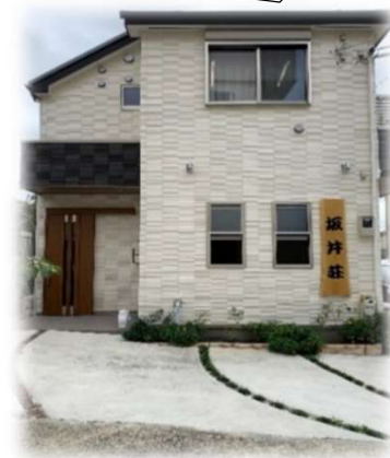
相談支援事業所外観