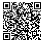
市 HP 案内ページ

【問い合わせ】立川市教育委員会事務局 教育部 学校給食課「愛称募集担当」 ☎ 042-529-3511