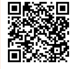
市 HP 応募フォーム

※ ほごしゃ かた そうだん おうぼ 保護者の方に相談をしてから応募してください。