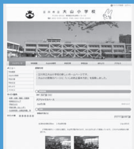
学校ホームページリニューアルしました(大山小学校)

学校からの情報発信の大切なツールであるホームページを更に分かりやすく発信するため、小学校は9月2日より、中学校は9月30日よりリニューアルしました。