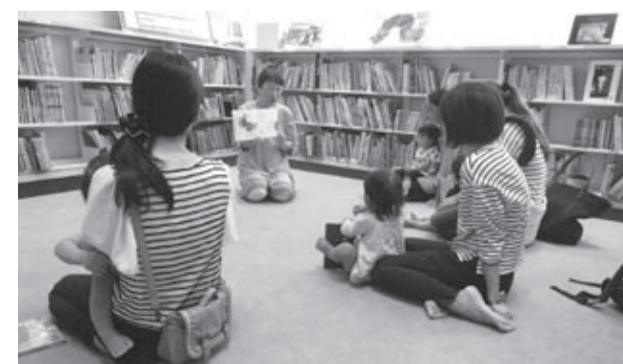
「おはなしトコトコ」の様子

柴崎図書館の一番の特徴は、第一小学校図書室と開閉可能なパーティションで仕切られていることです。学校がお休みの土・日曜日、夏休み等には、パーティションを開き、第一小学校の蔵書を図書館利用者の方が閲覧できます。また平日は第一小学校の児童が調べ学習などで柴崎図書館の蔵書を利用する場合もあります。学校教育と社会教育施設の複合施設として、異世代