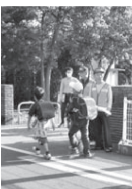
通学路点検の様子