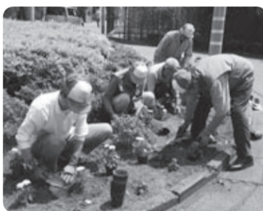
植え付け作業の様子