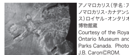
アノマロカリス(学名:アノマロカリス・カナデンシス)ロイヤル・オンタリオ博物館蔵