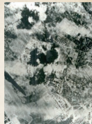
空襲を受ける立川飛行場

●応募方法 平成28年8月31日(水)[消印有効]までに、任意の用紙または各地域学習館・福祉会館で配布する原稿用紙に、題名、住所、氏名(ふりがな)、年齢、電話番号、希望の連絡方法があればその旨、戦争期の体験記(1,600字程度)を書いて、各地域学習館・福祉会館、歴史民俗資料館、生涯学習情報コーナーに持参するか、郵送、ファクス、Eメールで生涯学習推進センター[〒190-0012曙町2-36-2] ☎(527)5757 Fax(528)6806 Eshougai-suishin@city.tachikawa.lg.jpへ