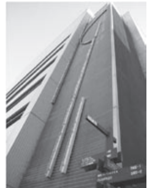
劣化で点灯しなくなった「Tessera(テセラ)-4」

109点のファールレ立川アートのうち、高さ45mの巨大な壁面ネオンアート「Tessera(テセラ)」(スティーヴン・アントナコスさん作・ギリシャ)のネオンが劣化のため点灯しなくなっています。アートに光を取り戻すため、インターネットを通じて広く支援金を募る「クラウドファンディング」を10月13日(火)まで実施しています。目標額は50万円。支援金に応じてお礼をご用意しています。ぜひご協力をお願いいたします。くわしくは、クラウドファンディングのホームページ https://readyfor.jp/ をご覧ください。