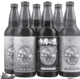
石川酒造 多摩の恵(地ビール) 6本