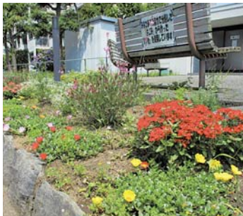
たい肥を用いた大山団地の花壇

市は、大山自治会と協働で、燃やせるごみから生ごみを分けて収集することで、燃やせるごみの減量に取り組んでいます。約850世帯のご協力により、年間約36トンの生ごみを収集し、その生ごみからたい肥を作っています。たい肥は、自治会内の花壇やプランターの花植えに有効活用されるほか、地域の小・中学校、市内の保育園に配布し、野菜や花づくり、子どもたちの学びにも役立っています。