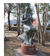
平和都市宣言記念碑