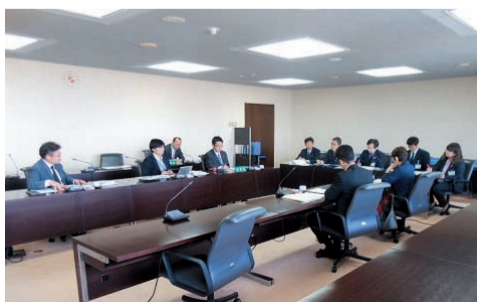
小平市視察の様子