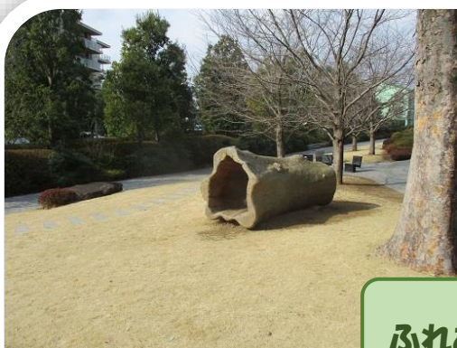
ふれあいの森公園