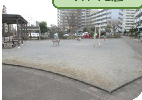
上砂町一丁目 アパート公園