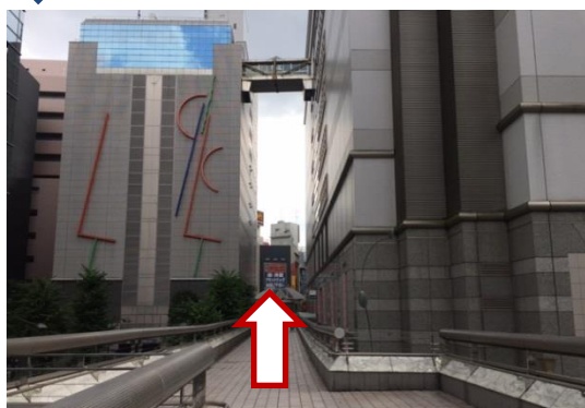
② デッキ上を道なりに歩きます。