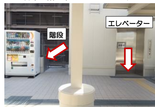
⑦ 自動販売機の隣に階段、またはエレベーターがあります。1番下の階まで下りてください。