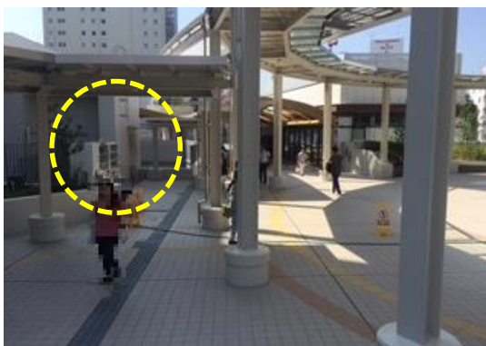
⑥ 窓口サービスセンターの入り口へは、タクロスの向かい側にある階段、またはエレベーターで1番下の階に下りていただきます。