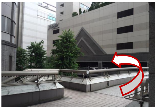
① 2階出口から出てデッキ上を、パレスホテルを右手に進みます。