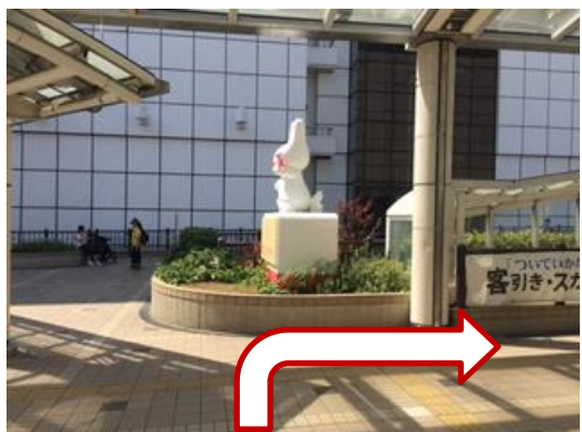
④ つきあたりを右に曲がります。 (正面にくるりんの像がありますので、像の手前を右に曲がってください。)