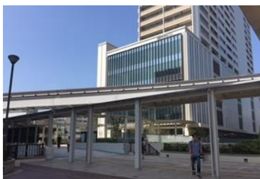
⑤ 正面方向に見える大きな建物がタクロスになります。