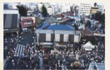
諏訪祭りでにぎわう立川駅南口駅前 (平成2年撮影)