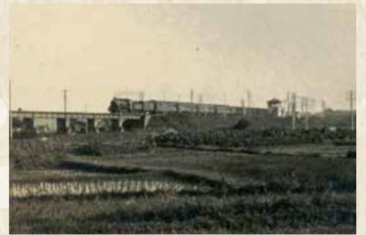
中央線多摩川鉄橋を渡る汽車 (昭和初期撮影)