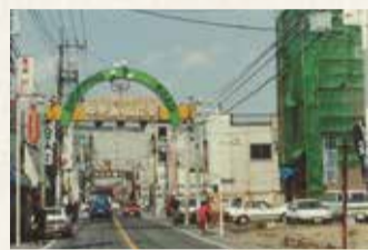
立川中央通り商店会(現南口大通り) (昭和63年撮影)