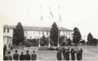
立川基地返還式典 (昭和52年撮影)

写真資料785点を、行きかう人びとの「足」、まちをはぐくんだ水、街角の風景などの9つのテーマに分けて掲載し、明治時代から現在に至る立川市の街並みの変化や発展の様子を、一冊の写真集としてまとめました。掲載した写真資料のうち146点は、市史編さん事業に際して市内外の方々から新たに提供いただいた資料です。