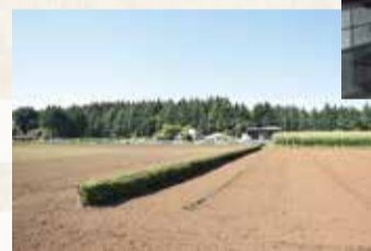
畑・境木(茶の木)・雑木林(西砂町)

砂川地区(合併前の砂川町の範囲)の民俗調査の成果を掲載しました。江戸時代の新田開墾から始まる砂川の歴史と生業、社会、衣食住、人生儀礼などの調査を中心に、桑苗生産など、かつて盛んだった産業の事例なども取り上げました。また、立川駅や立川飛行場の設置などに伴い大きく変貌してきた砂川の暮らしも明らかにしています。