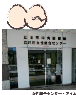
女性総合センター・アイム