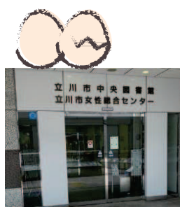
女性総合センター・アイム