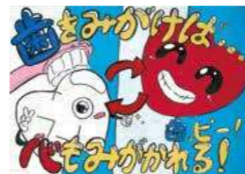
令和7年度 最優秀作品 立川市立第八小学校 6年 獨古にい榔