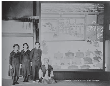
井出久美子著『徳川おてんば姫』東京キララ社刊より

日本古来の大和絵を継承し、「大政奉還」(聖徳記念絵画館蔵)を砂川村で描いた邨田丹陵について学びます。初の単行本発行を目指すプロジェクトの一環として、最新の調査研究と出版計画に触れます。