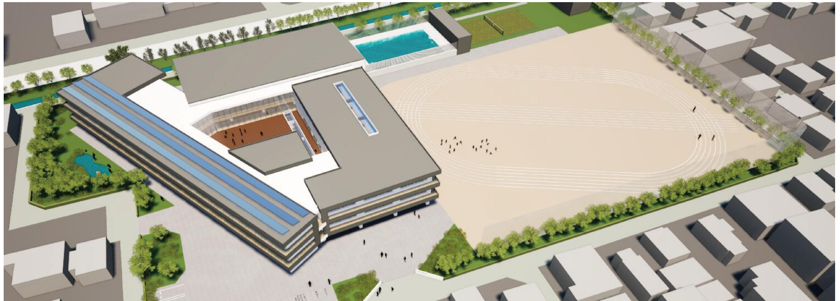
校舎外観イメージ