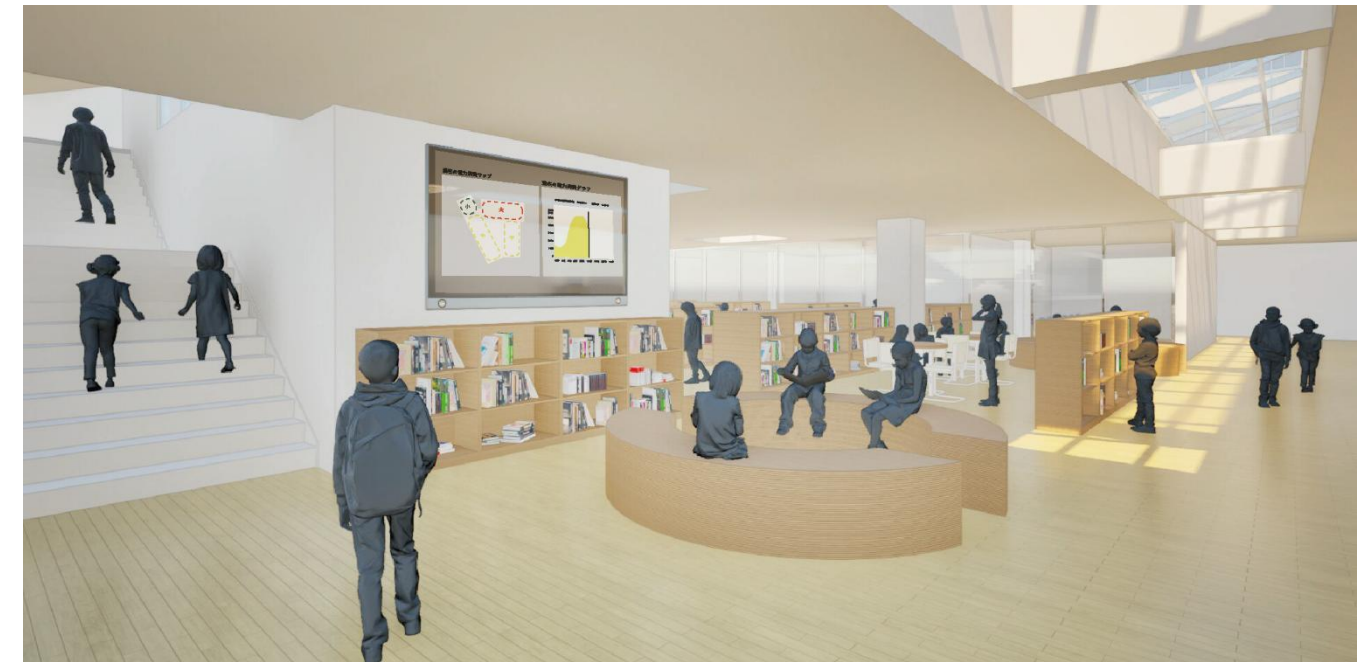
メディアセンターイメージ