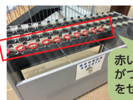
赤いコイルブレスレットがついているところに傘をセットします。

傘立てにセットできない形状の傘をお持ちの場合は傍聴受付の職員へお声掛けください。