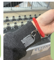
写真のように、手首に着けて傍聴席へお入りください。