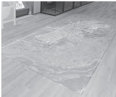
わが家はどのあたりにかな？