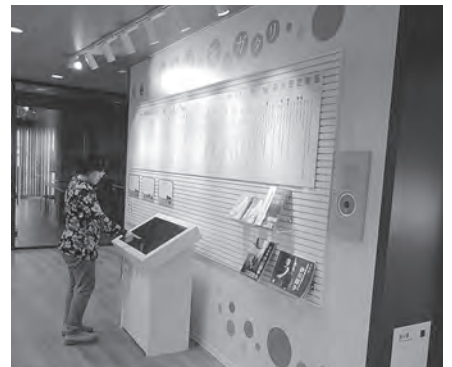
デジタルサイネージで学んでみる