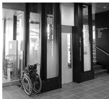
車椅子とエレベーター

講堂ではこの日、寿教室が開かれ、美しい歌声が響いていました。砂川寿教室では健康体操、コーラス、フラダンスの講座が水曜日毎に週替わりで開かれています。60歳以上の住民の生きがいや仲間、健康づくりを目指しています。