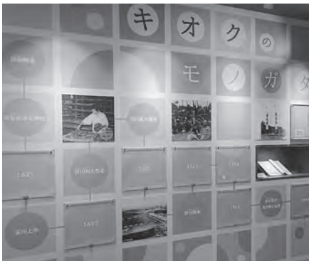
「キオクのモノガタリ」をたどってみよう

2026年2月にオープンした砂川学習館を訪問しました。新しい学習館は「学び」「子育て」「コミュニティ」の機能を持つ複合施設として生まれ変わりました。学習館2階壁面には砂川の歴史が「マナビのモノガタリ」として展示され、訪れる人の足を止めています。床面には旧砂川町域の航空写真が施されており、ここで自宅の場所を探してみたいはかがでしょう。