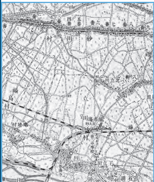
1:50000「青梅」 大正4年(1915)鉄道補入