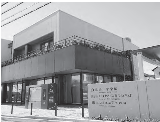
砂川学習館の外観