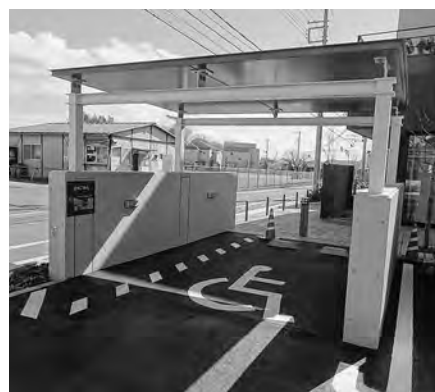
屋根付車椅子利用者用駐車場