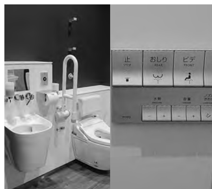
多目的トイレ 個室は洗浄式トイレ