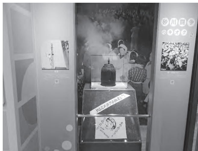
展示されている半鐘