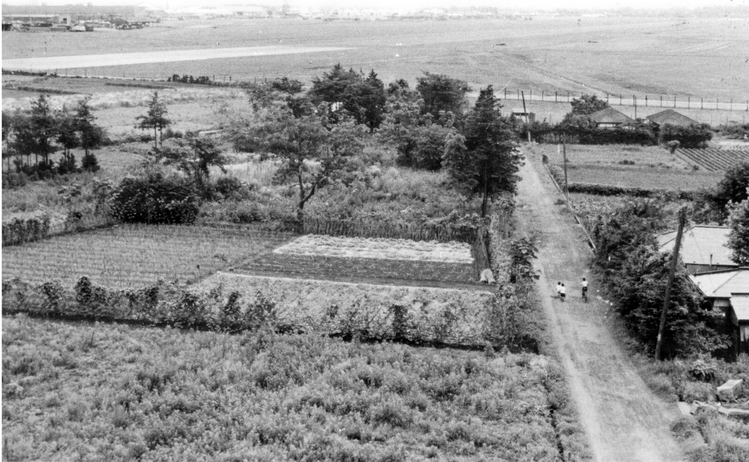
砂川町役場前の火の見やぐらから立川基地を望む・昭和31(1956)年頃