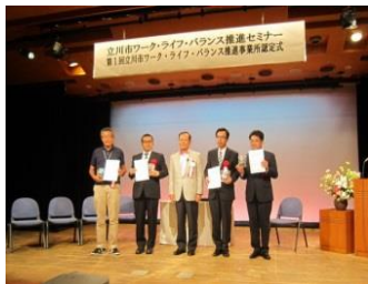
平成24年度第1回立川市ワーク・ライフ・バランス推進事業所認定式

ワーク・ライフ・バランスとは仕事と生活の調和の実現に向けた取り組みです。立川市では、ワーク・ライフ・バランスの推進に積極的に取り組んでいる市内の事業所を認定しています。認定事業所には認定証を発行し、取り組みについて市ホームページや市報等で広く紹介します。来年度も認定事業所を募集します。応募方法やお問合せは立川市男女平等参画課へご連絡ください。