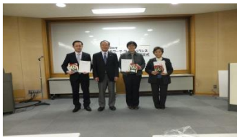
平成28年度第5回立川市ワーク・ライフ・バランス推進事業所認定式

ワーク・ライフ・バランスとは仕事と生活の調和の実現に向けた取り組みです。立川市では、ワーク・ライフ・バランスの推進に積極的に取り組んでいる市内の事業所を認定しています。認定事業所には証を発行し、取り組みについて市ホームページや市報等で広く紹介します。