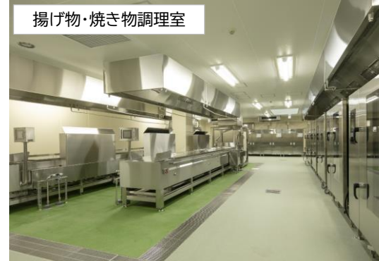
揚げ物・焼き物調理室

●煮炊き調理室 容量が350Lの回転釜と呼ばれる大きな機器で汁物・煮物・炒め物・ゆで物の調理を行います(1釜で一度に1000人分作ることができます)。東調理場には、回転釜が全部で19基あって、そのうち、立川市の給食のこだわりでもある手作りルウを作るため、ガス式の回転釜も2基備えています。