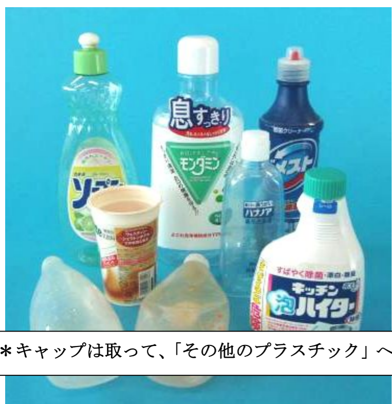
*キャップは取って、「その他のプラスチック」へ