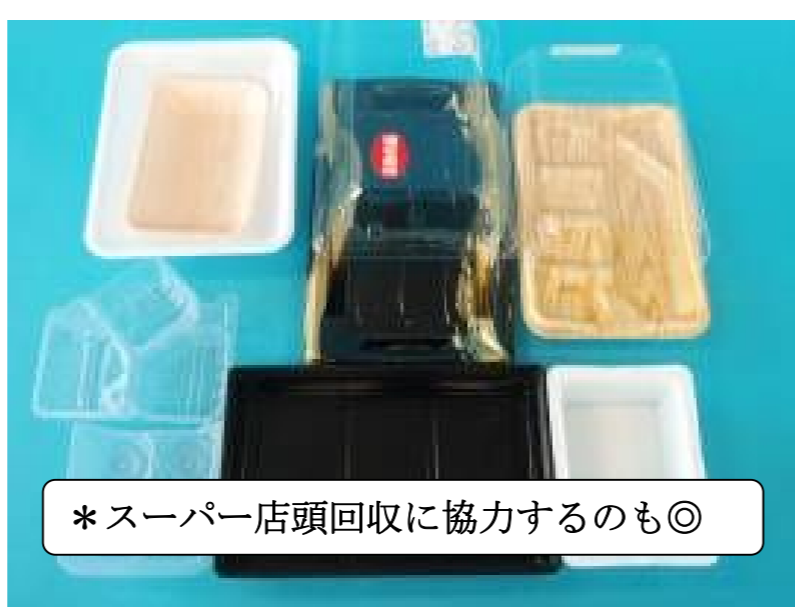
*スーパー店頭回収に協力するのも◎