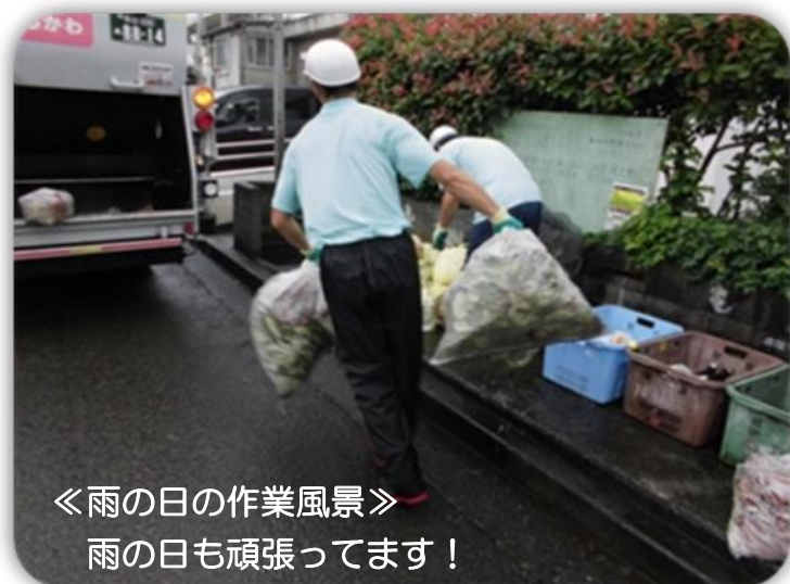
《雨の日の作業風景》 雨の日も頑張ってます！