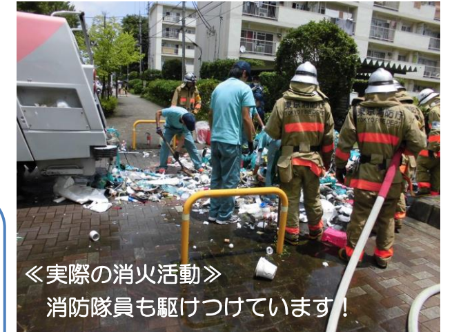
《実際の消火活動》 消防隊員も駆けつけています！

収集車内での火災事故が相次いで発生しております。「燃やせないごみ」に混入していたスプレー缶やライター、乾電池が原因と思われます。中身が残っていると収集・処理する過程で、爆発や火災事故の原因となり、大変危険です。安全なごみ収集・処理のためにご協力をお願いします。