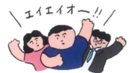
さらピカファミリー

カラスの一番の好物は食べ残しや野菜くずなどの生ごみをなるべく出さないように、2ページのチャレンジ1「生ごみを減らそう」を参考に、生ごみ減量を心がけましょう。