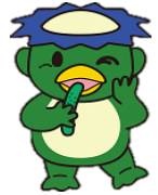
昭島市公式キャラクターちっぽー