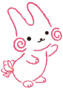
立川市公式キャラクターくるりん

ある日、突然訪れた大きな悲しみと、誰にも分かってもらえない辛さ、いつまで続くのか分からない苦しみ、いくら考えても分からない答え……。身近な人を自死(自殺)でなくされた方が集まり、ありのままの胸の内を語り合い、聴き合い、そして支え合う場として、「昭島市・立川市わかちあいの会」を開催します。お互いを尊重し、プライバシーを守りながら、支え合いの輪が広がっていくことを願っています。※原則 18歳以上の方