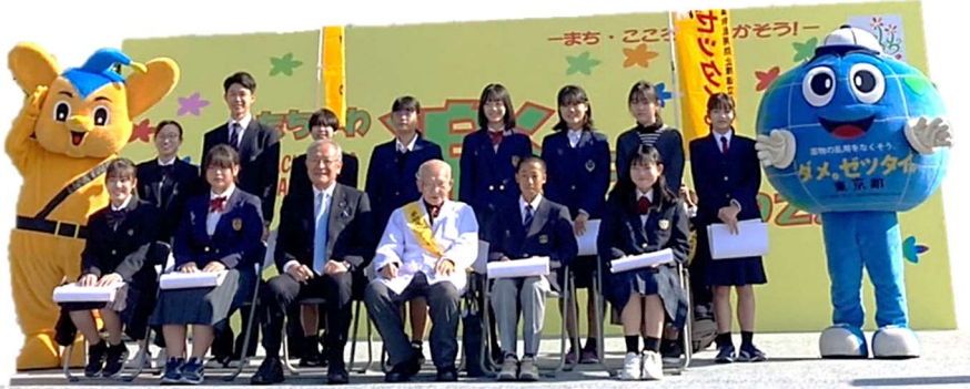
表彰式後の記念撮影

令和4年11月12日(土)、秋晴れのもと『第26回立川市薬物乱用ダメ・ゼツタイフェア』が「たちかわ楽市2022」(国営昭和記念公園緑の文化ゾーン)にて開催され、青少年健全育成各地区委員会も協力団体として参加しました。