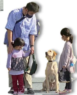
麻薬探知犬 ジャック(旅具犬)

東京税関所属の麻薬探知犬ルル(貨物犬)とジャック(旅具犬)が登場し、それぞれが貨物品や旅行者の手荷物の中から違法薬物を見事に探り当て、日頃の活躍の一端を見ることができました。