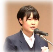
今を生きる 天神 リオさん 立川第三中 三年