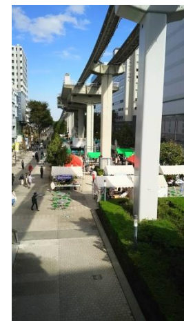
サンサンロード (イベント実施時)