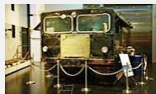
昭和基地から南極点まで 観測旅行へ行った雪上車 が展示してあります。旅 行距離(往復5,182km)は 世界一！