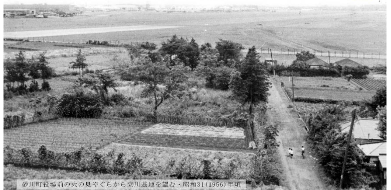
砂川町役場前の火の見やぐらから立川基地を望む・昭和31（1956）年頃

会場：女性総合センター・アイム 1階ホール 先着100名・参加費無料・事前申込不要・手話通訳あり