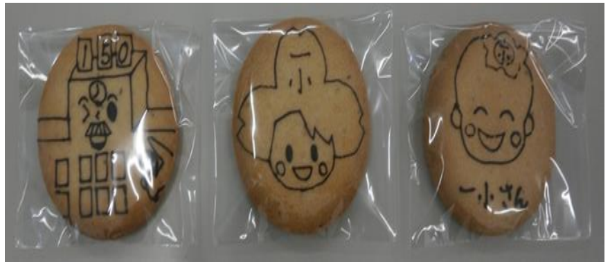
柴崎町「ピスターシュ」とコラボして販売しているクッキー

その他に、地元商店「菊川園」とのコラボ商品「一小オリジナル茶」、「カフェ・ド・ビヨンド」と子ども達が商品開発したコラボランチ等も好評提供中です。